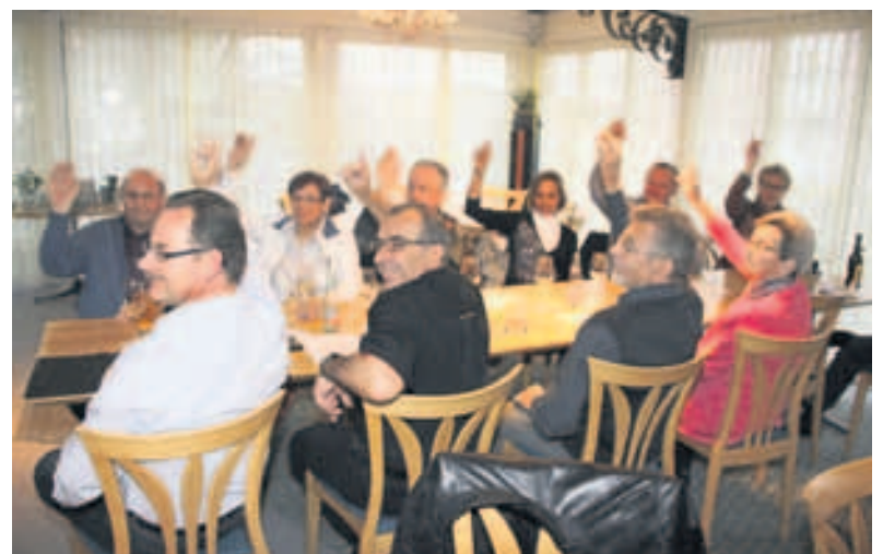
Der Fusion wurde einstimmig zugestimmt.