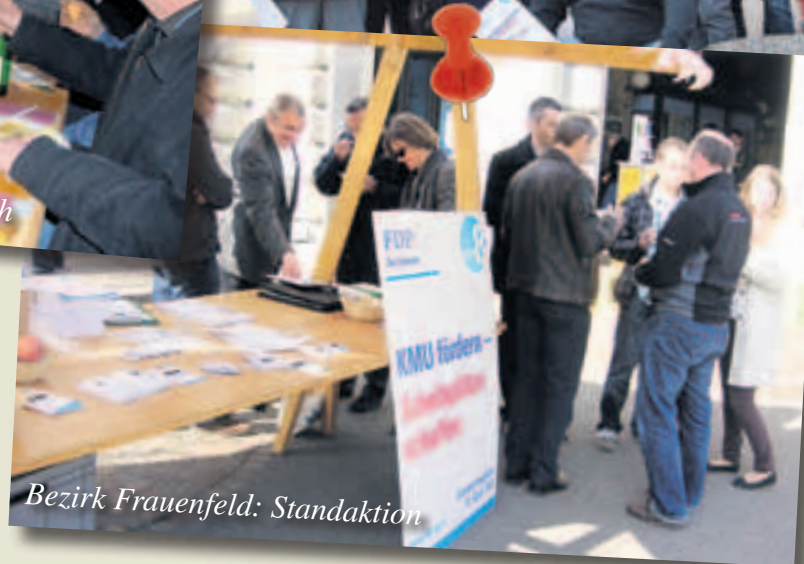
Bezirk Frauenfeld: Standaktion