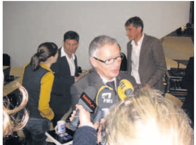
Ganz frisch gewählt: Medienrummel um den neuen St. Galler Regierungsrat Martin Klöti.