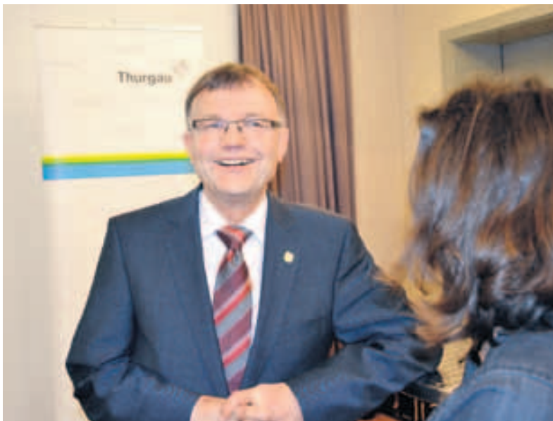
Im Wahlzentrum in der Kantonsbibliothek: die Freude des wiedergewählten Kaspar Schläpfer!