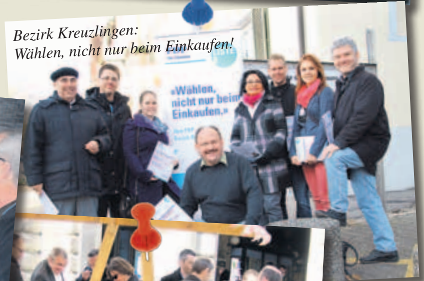
Bezirk Kreuzlingen: Wählen, nicht nur beim Einkaufen!