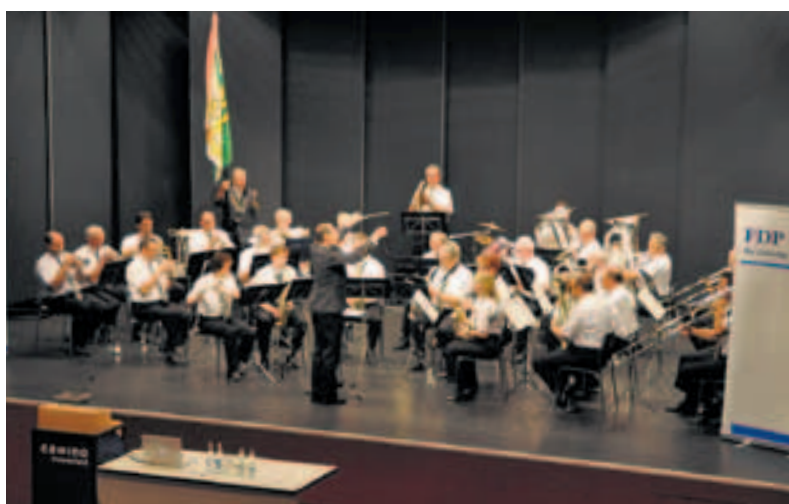
Das Spiel der Kantonspolizei Frauenfeld.

er eine ideale Besetzung für das Bundesratsgremium. Er weiss, wovon er spricht – und das spürt man bei jedem Wort. Jetzt heisst es, diese liberalen