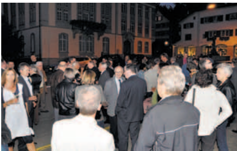
Apéro auf der Strasse.