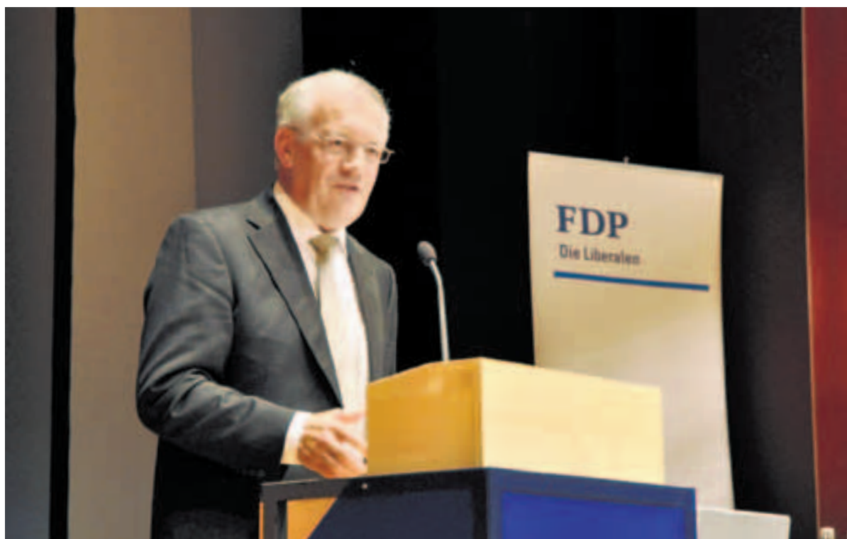
Bundesrat Johann Schneider-Ammann während seines Referats.

Der Auftritt von Bundesrat Johann Schneider-Ammann war eine Wohltat in einer Zeit, in welcher in der Politik nur noch Angriffe auf Personen und Schlagworte zählen. BR Schneider-Ammann hat aufgezeigt, warum es gerade die liberalen Kräfte in diesem Land sind, welche die Schweiz zu einer der Spitzennationen auf dieser Welt gemacht haben. Umsichtiges Handeln, verantwortungsvolle Politik und konstruktives Miteinander lebt BR Schneider-Ammann täglich vor.