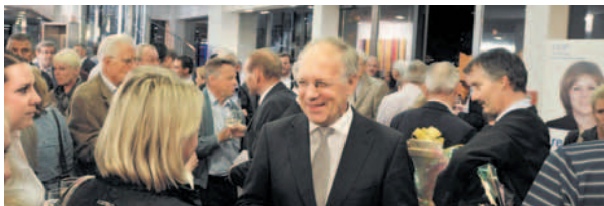
Bundesrat Johann Schneider-Ammann am Apéro im Anschluss an die Veranstaltung.